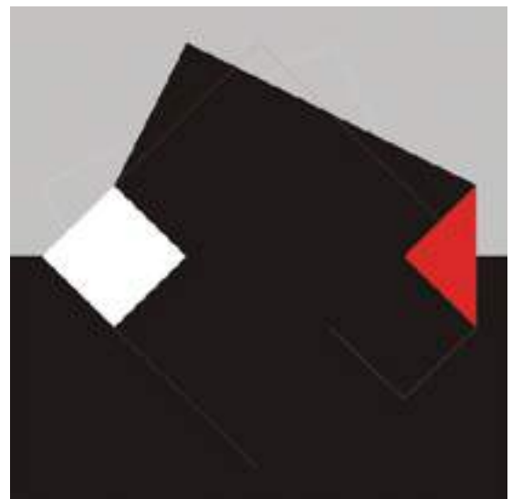
Aleksander Olszewski - 30x30 nr1 , druk cyfrowy, papier, 30 x 30 cm, 2019 r.