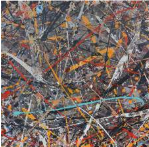
Dariusz Jędrasiewicz - bez tytułu , olej, płótno, nie datowany