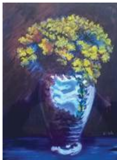
Henryka Lech - Kaczeńce , pastel, papier, 40 x 30 cm, nie datowany