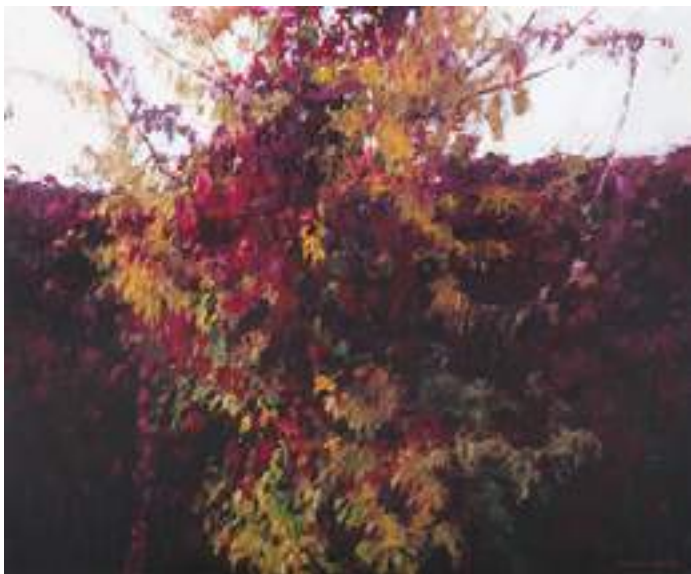
Witold Tomasz Kowalski - Bordowy , akryl, płótno, 80 x 100 cm, 2019 r.