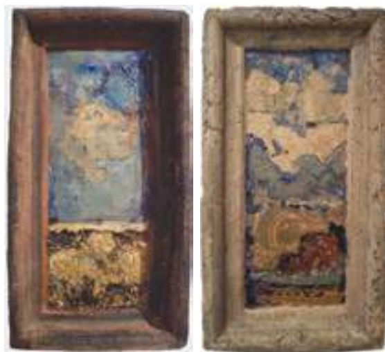
Jacek Szpak - Cztery pory roku / Lato, Zima , ceramika szklwiona, (4x) 50 x 30 cm, 2019 r.