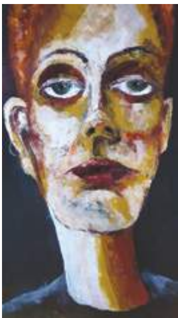
Agnieszka Żabińska - Ona 2 , olej, płótno, 72 x 52 cm, 2019 r.