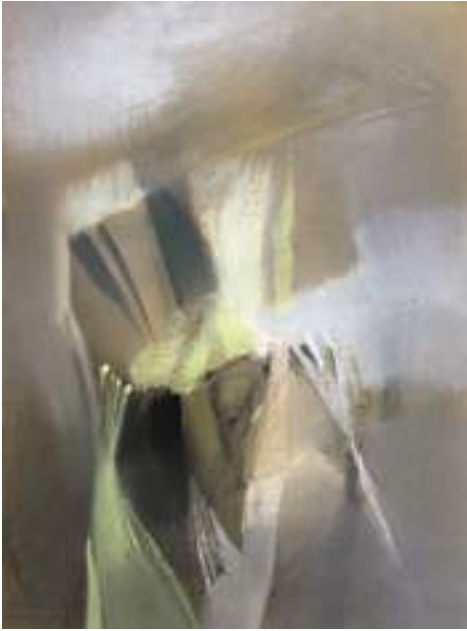
Jolanta Jastrzębska-Jakiel - Reflection... You know why , pastel, papier, 100 x 70 cm, 2019 r.