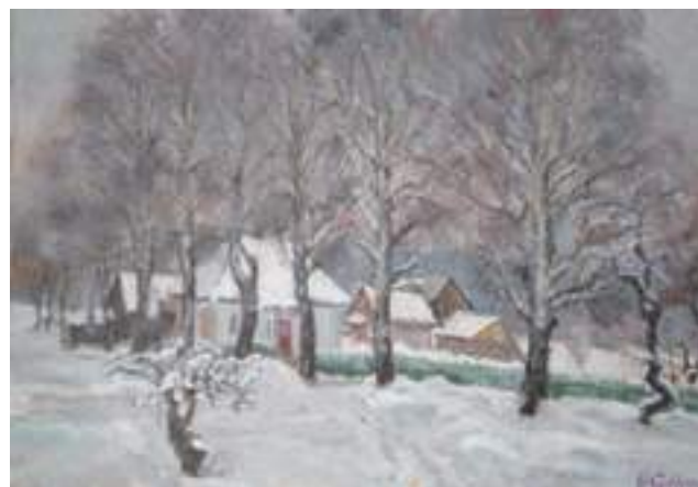
Hilary Gilewski - Leśniczówka w Czarn. Białostockiej , olej, płótno, 38 x 55 cm, 1995 r.