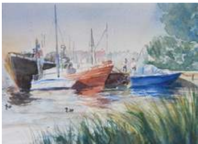
Katarzyna Aderek - Plener 4-6-2019 , akwarela, 22 x 39 cm, 2019 r.