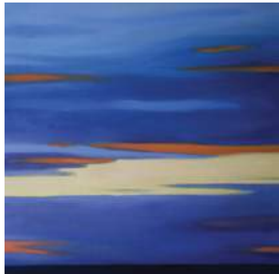
Tomasz Wróblewski - Baltic Sea , Olej, płótno, 60 x 60 cm, 2019 r.