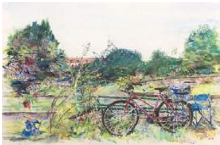
Bożenna Popławska - Popołudnie w szkolnym ogrodzie w Solcu n. Wisłą , akwarela, papier, 36 x 55 cm, 2020 r.