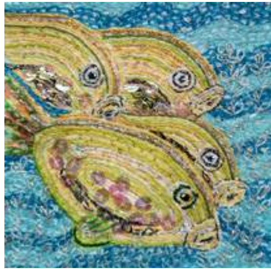
Alina Włodarz - Ryby , miniatura tkacka, 20 x 20 cm, 2019 r.