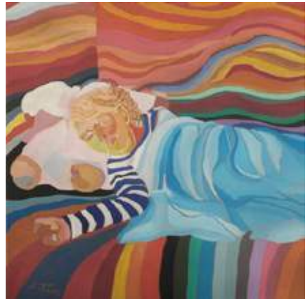
Leszek Kłos - Sen , olej, płótno, 90 x 90 cm, 2018 r.