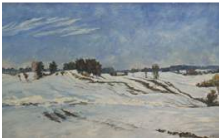
Hilary Gilewski - Przedwiośnie , olej, płótno, 40 x 64 cm, 1995 r.