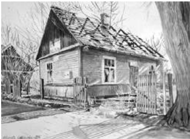
Małgorzata Wróblewska - Wypalony dom , ołówek, akryl, papier, 50 x 70 cm, 2016 r.