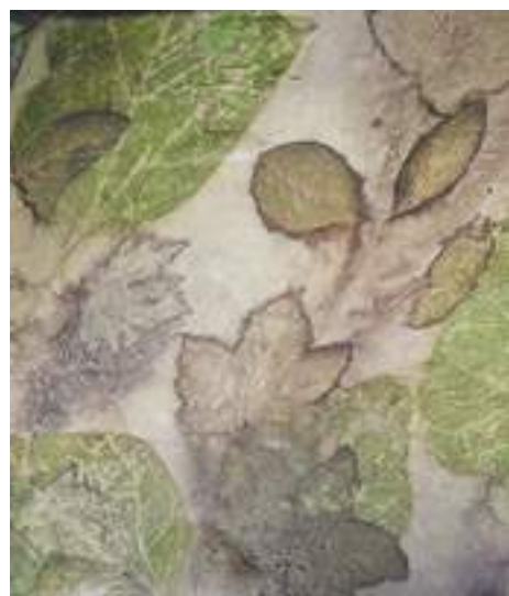
Izabela Zalewska-Kantek - Ecoprint (fragment) , eco printing, liście drzew, jedwab, 150 x 60 cm, 2019 r.