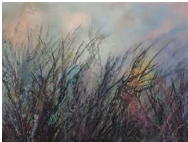
Jakub Strzelecki - Bez tytułu , akryl, płótno, 40 x 60 cm, 2019 r.