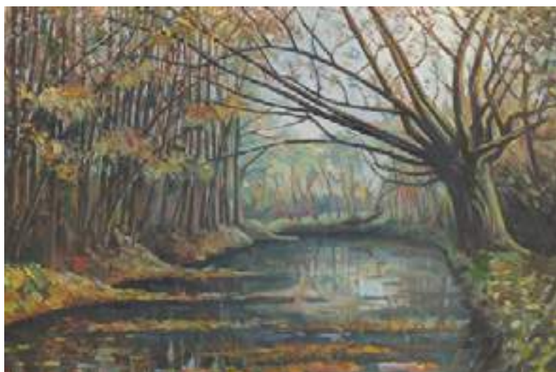
Zdzisław Doleżyński - Wierzy na księdza ogrodzie , olej, płótno, 81 x 100 cm, 2009 r.