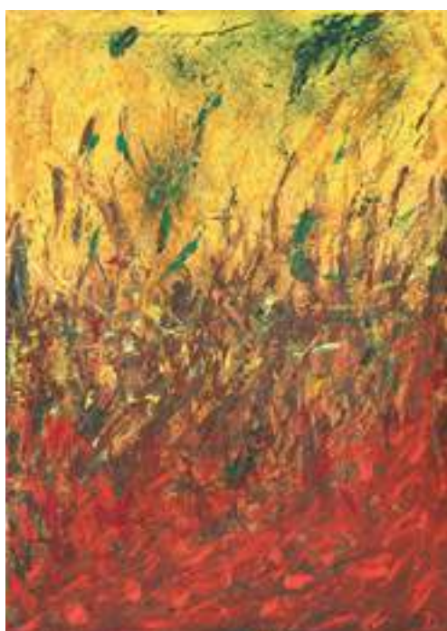
Ireneusz Domański - Nigdy nie przestanie mnie to cieszyć , akryl, płótno, 70 x 50 cm, 2014 r.