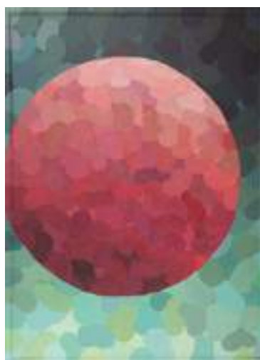
Jan Andrzej Jasiński - Barwy ochronne A, B, C , akryl, płyta, (3x) 74 x 55 cm, 2019 r.