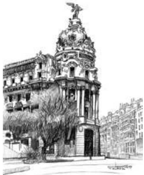
Tadeusz Kurek - Madryt centrum , ołówek, papier, 29,7 x 21 cm, 2019 r.