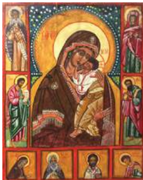
Stanisław Drąg - Matka Boża wśród Świętych , tempera, deska, 58 x 43 cm, 2017 r.