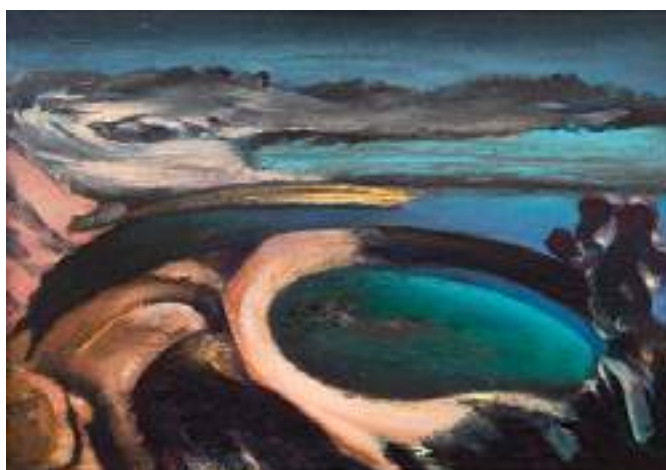
Longin Pinkowski - Fiordy , olej, płótno, 38 x 54 cm, 2019 r.