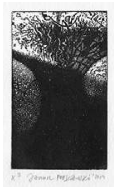
Janusz Popławski - Ex A , linoryt, 7,4 x 4,4 cm, 2014 r.