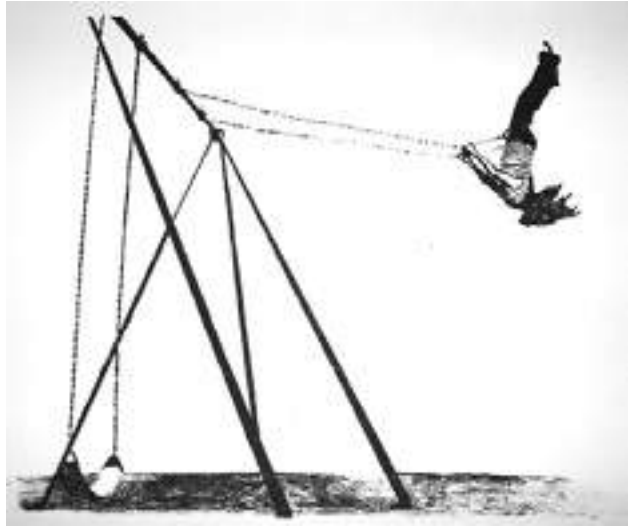
Anna Iwańska - XXX , litografia, 20 x 30 cm, 2019 r.