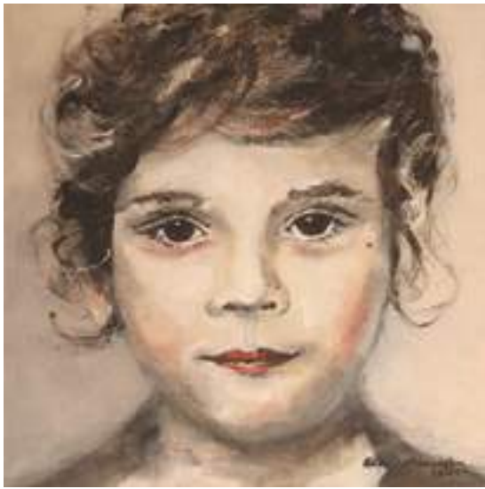
Eliza Wilczyńska - Portret 1 , olej, płótno, 30 x 30 cm, 2019 r.